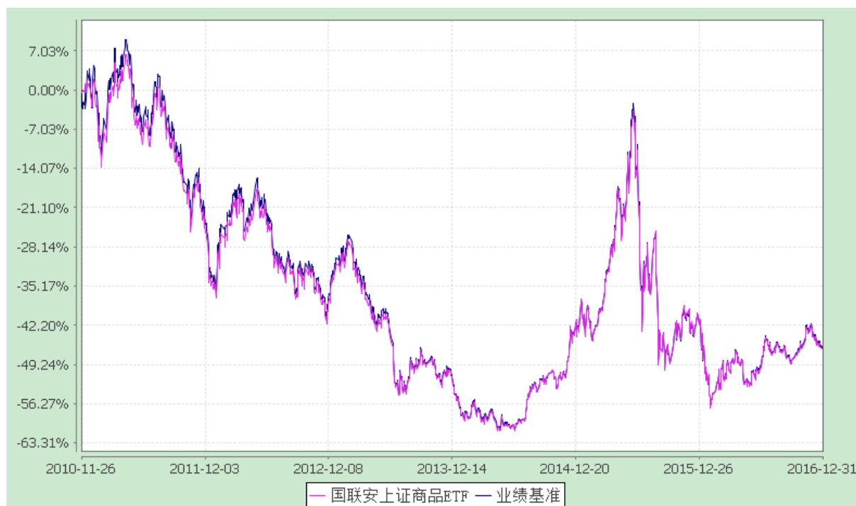
上证大宗商品股票交易型开放式指数证券投资基金 份额累计净值增长率与业绩比较基准收益率的历史走势对比图 (2010 年 11 月 26 日至 2016 年 12 月 31 日)