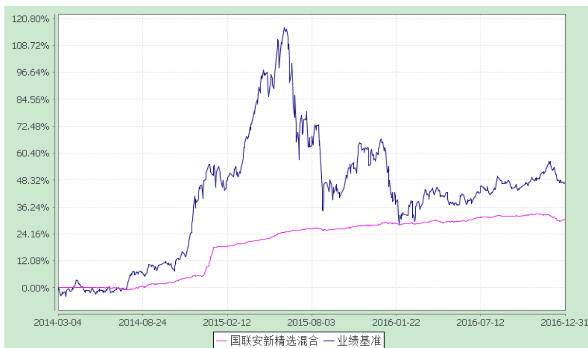
国联安新精选灵活配置混合型证券投资基金 份额累计净值增长率与业绩比较基准收益率的历史走势对比图 (2014 年 3 月 4 日至 2016 年 12 月 31 日)