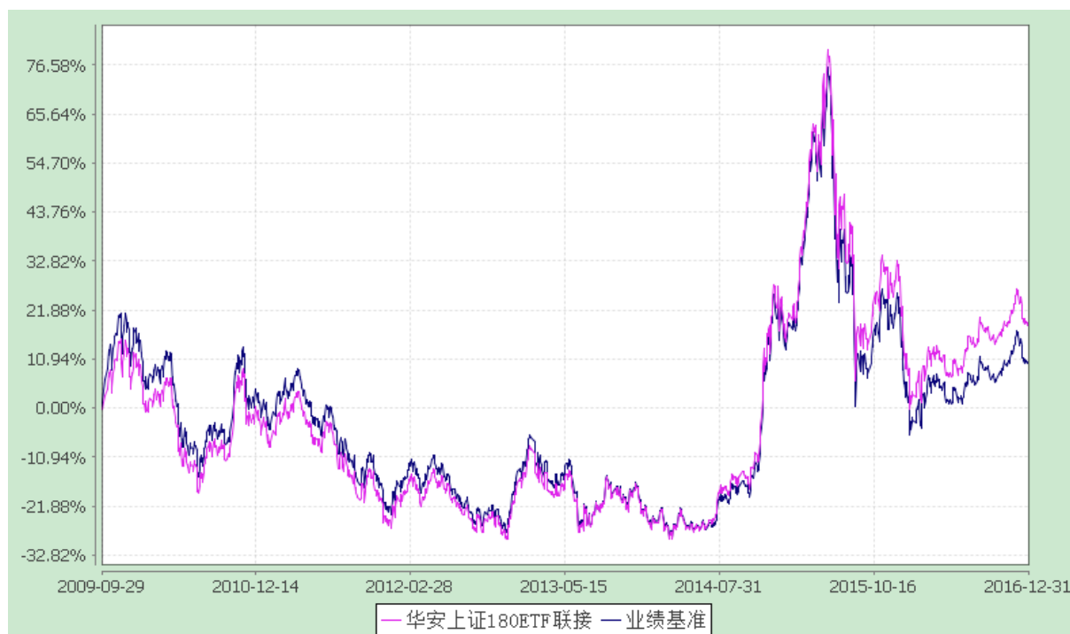
华安上证 180 交易型开放式指数证券投资基金联接基金 份额累计净值增长率与业绩比较基准收益率的历史走势对比图 (2009 年 9 月 29 日至 2016 年 12 月 31 日)