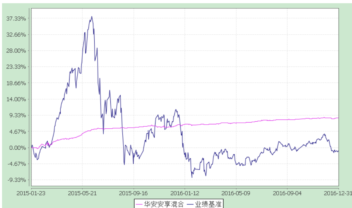
华安安享灵活配置混合型证券投资基金 份额累计净值增长率与业绩比较基准收益率的历史走势对比图 (2015 年 1 月 23 日至 2016 年 12 月 31 日)