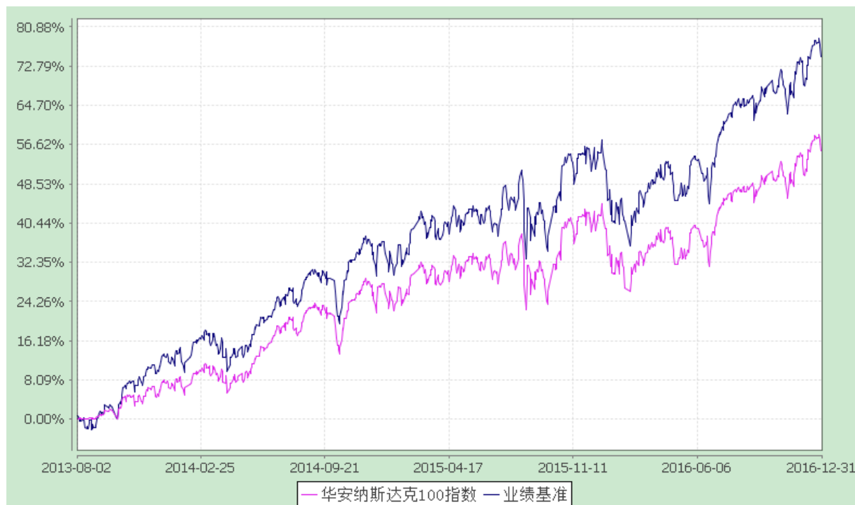
华安纳斯达克 100 指数证券投资基金 份额累计净值增长率与业绩比较基准收益率历史走势对比图 (2013 年 8 月 2 日至 2016 年 12 月 31 日)