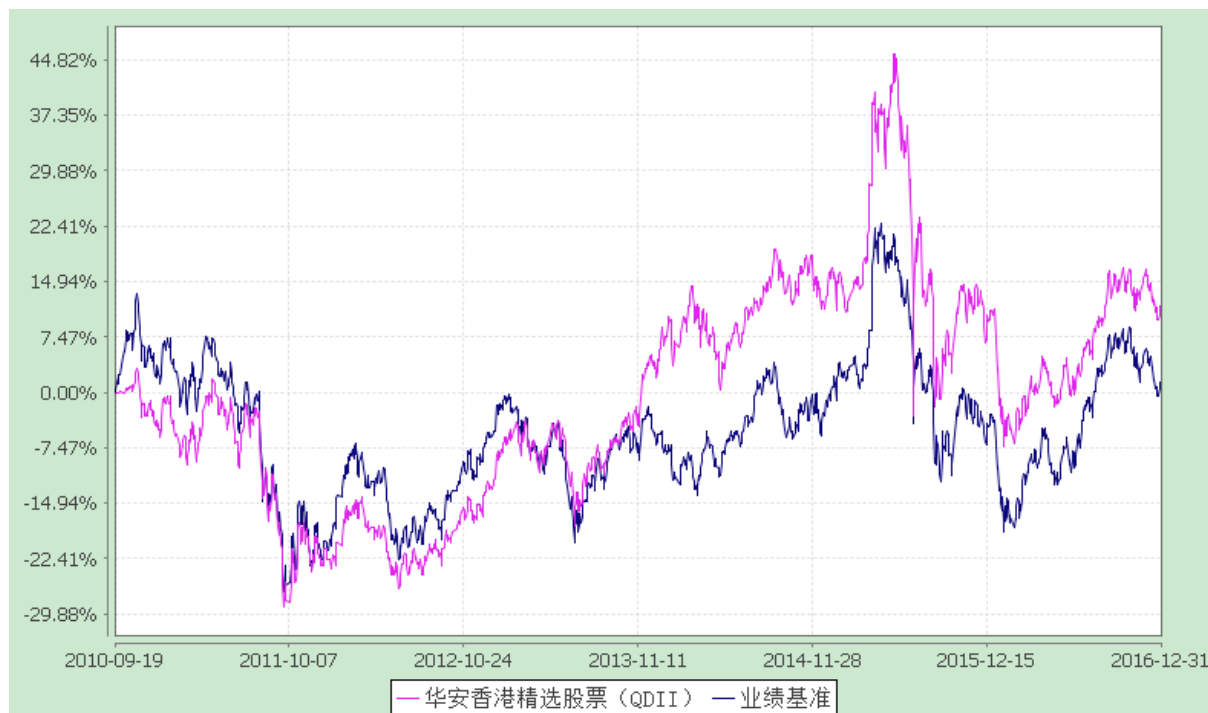
华安香港精选股票型证券投资基金 份额累计净值增长率与业绩比较基准收益率历史走势对比图 (2010 年 9 月 19 日至 2016 年 12 月 31 日)