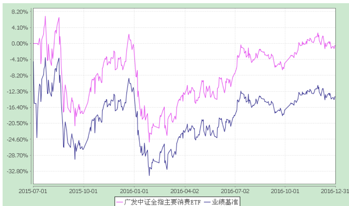
广发中证全指主要消费交易型开放式指数证券投资基金 份额累计净值增长率与业绩比较基准收益率的历史走势对比图 (2015年7月1日至2016年12月31日)