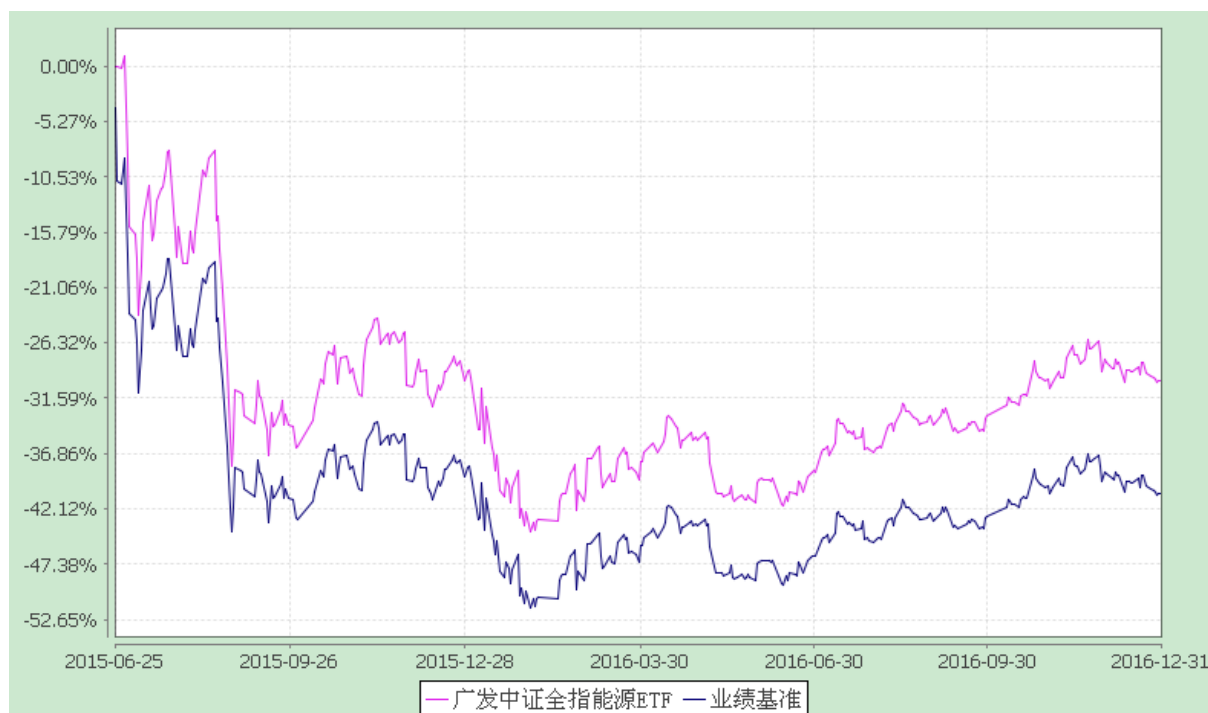
广发中证全指能源交易型开放式指数证券投资基金 份额累计净值增长率与业绩比较基准收益率的历史走势对比图 (2015年6月25日至2016年12月31日)