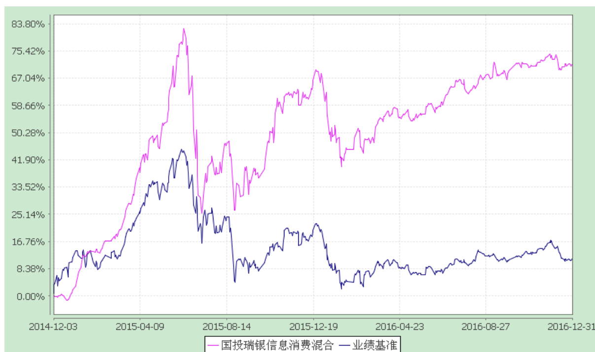
国投瑞银信息消费灵活配置混合型证券投资基金 份额累计净值增长率与业绩比较基准收益率的历史走势对比图 (2014 年 12 月 3 日至 2016 年 12 月 31 日)

注：本基金建仓期为自基金合同生效日起的 6 个月。截至建仓期结束，本基金各项资产配置比例符合基金合同及招募说明书有关投资比例的约定。