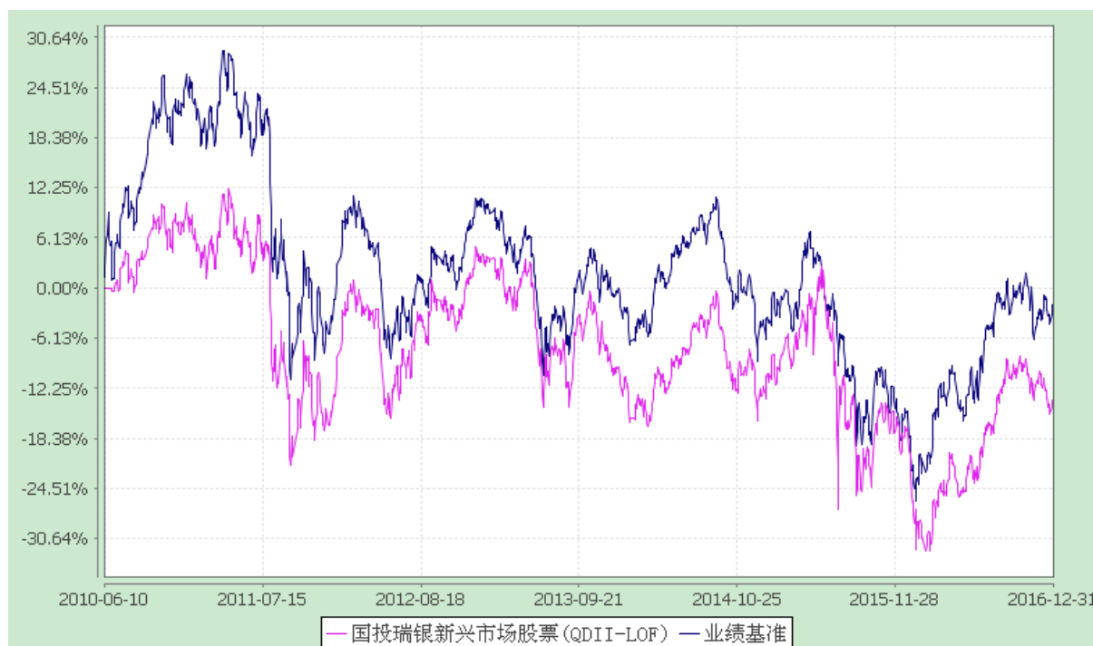
国投瑞银全球新兴市场精选股票型证券投资基金（LOF） 份额累计净值增长率与业绩比较基准收益率历史走势对比图 (2010年6月10日至2016年12月31日)

注：本基金建仓期为自基金合同生效日起的6个月。截至建仓期结束，本基金各项资产配置比例符合基金合同及招募说明书有关投资比例的约定。