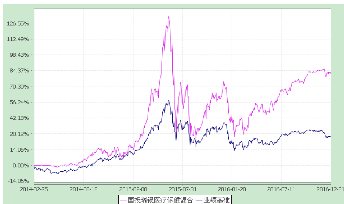
国投瑞银医疗保健行业灵活配置混合型证券投资基金 份额累计净值增长率与业绩比较基准收益率的历史走势对比图 (2014 年 2 月 25 日至 2016 年 12 月 31 日)

注：本基金建仓期为自基金合同生效日起的 6 个月。截至建仓期结束，本基金各项资产配置比例符合基金合同及招募说明书有关投资比例的约定。