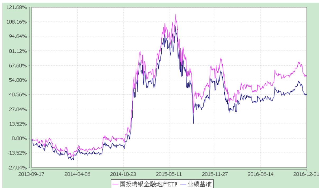
国投瑞银沪深 300 金融地产交易型开放式指数证券投资基金 份额累计净值增长率与业绩比较基准收益率的历史走势对比图 (2013 年 9 月 17 日至 2016 年 12 月 31 日)

注：本基金建仓期为自基金合同生效日起的 3 个月。截至建仓期结束，本基金各项资产配置比例符合基金合同及招募说明书有关投资比例的约定。