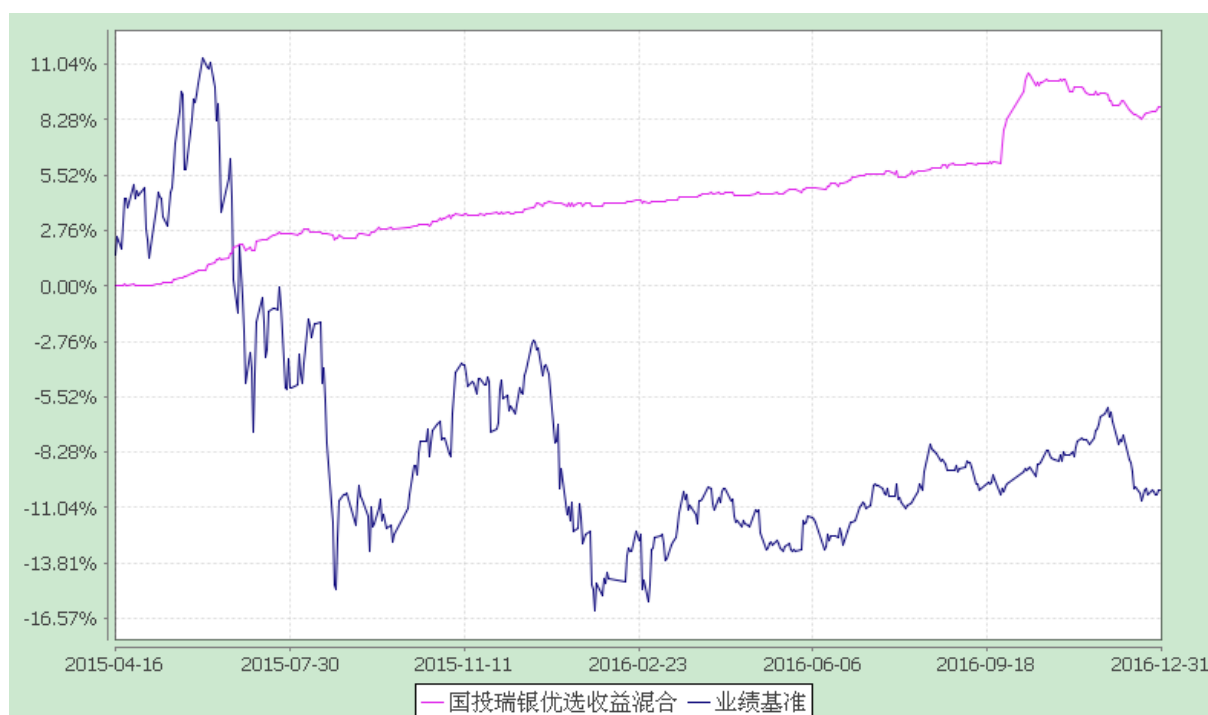
国投瑞银优选收益灵活配置混合型证券投资基金 份额累计净值增长率与业绩比较基准收益率的历史走势对比图 (2015 年 4 月 16 日至 2016 年 12 月 31 日)

注：本基金建仓期为自基金合同生效日起的 6 个月。截至建仓期结束，本基金各项资产配置比例符合基金合同及招募说明书有关投资比例的约定。