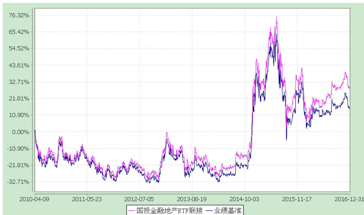
国投瑞银沪深 300 金融地产交易型开放式指数证券投资基金联接基金 份额累计净值增长率与业绩比较基准收益率的历史走势对比图 (2010 年 4 月 9 日至 2016 年 12 月 31 日)

注：2013 年 11 月 5 日起国投瑞银沪深 300 金融地产指数证券投资基金（LOF）转型变更为国投瑞银沪深 300 金融地产交易型开放式指数证券投资基金联接基金（简称“本基金”）。《国投瑞银沪深 300 金融地产交易型开放式指数证券投资基金联接基金基金合同》于 2013 年 11 月 5 日起生效。本基金建仓期为自基金合同生效日起的 3 个月。截至建仓期结束，本基金各项资产配置比例符合基金合同及招募说明书有关投资比例的约定。