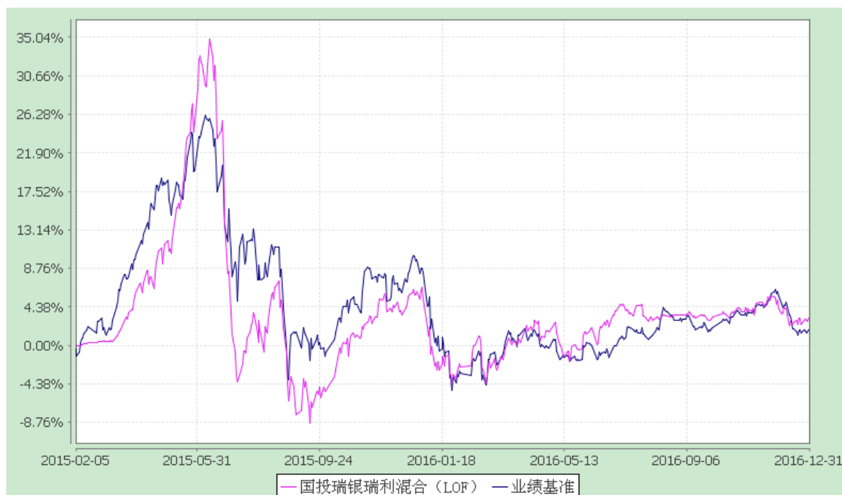
国投瑞银瑞利灵活配置混合型证券投资基金（LOF） 份额累计净值增长率与业绩比较基准收益率的历史走势对比图 (2015年2月5日至2016年12月31日)