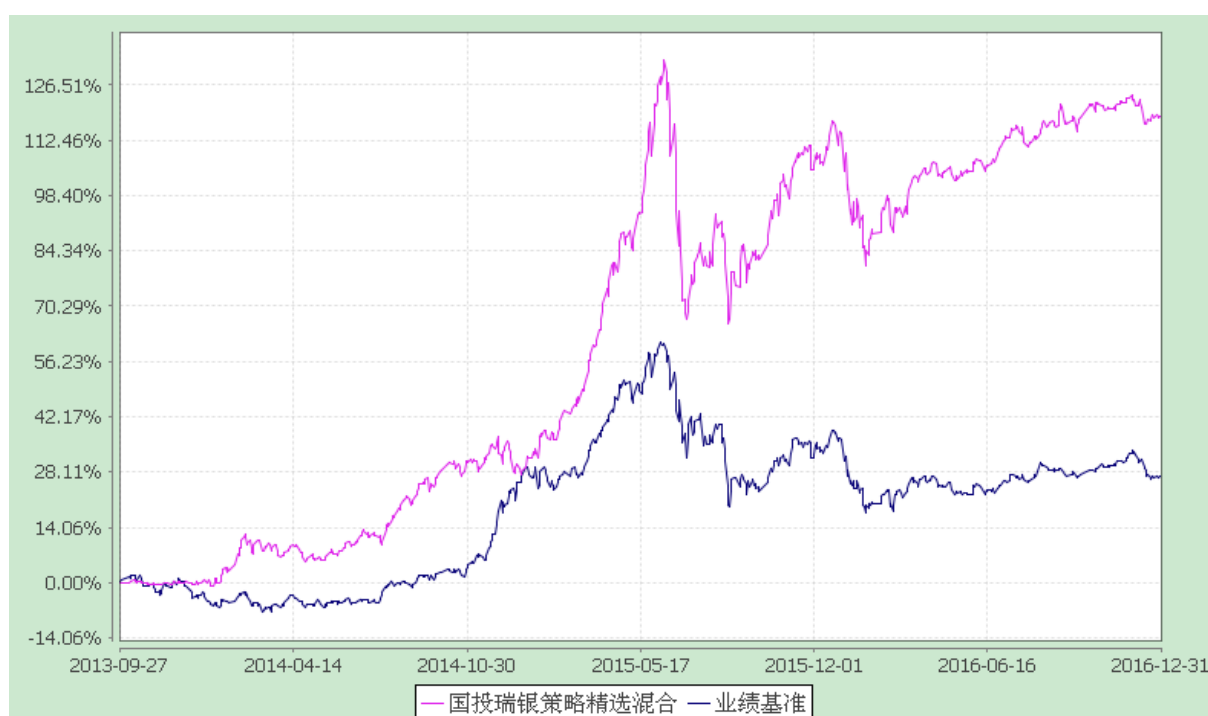
国投瑞银策略精选灵活配置混合型证券投资基金 份额累计净值增长率与业绩比较基准收益率的历史走势对比图 (2013 年 9 月 27 日至 2016 年 12 月 31 日)

注：本基金建仓期为自基金合同生效日起的 6 个月。截至建仓期结束，本基金各项资产配置比例符合基金合同及招募说明书有关投资比例的约定。