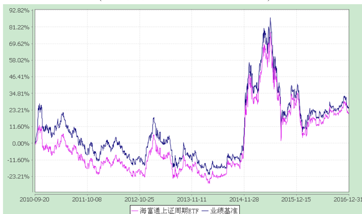
上证周期行业 50 交易型开放式指数证券投资基金 份额累计净值增长率与业绩比较基准收益率的历史走势对比图 (2010 年 9 月 19 日至 2016 年 12 月 31 日)