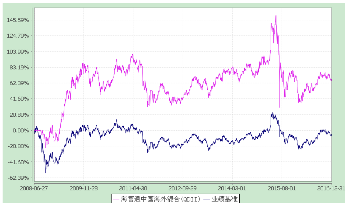
海富通中国海外精选混合型证券投资基金 份额累计净值增长率与业绩比较基准收益率历史走势对比图 (2008 年 6 月 27 日至 2016 年 12 月 31 日)