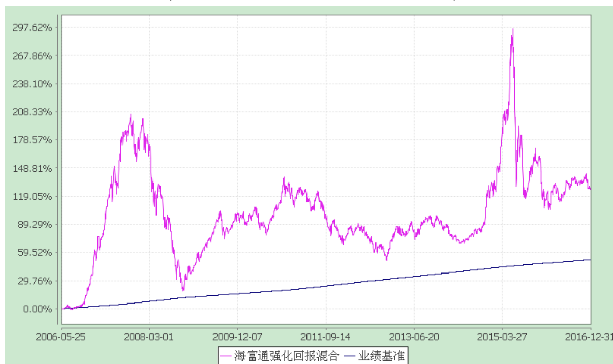
海富通强化回报混合型证券投资基金 份额累计净值增长率与业绩比较基准收益率的历史走势对比图 (2006年5月25日至2016年12月31日)

注：按照本基金合同规定,本基金建仓期为基金合同生效之日起六个月。建仓期满至今,本基金投资组合均达到本基金合同第十二条(二)、(七)规定的比例限制及本基金投资组合的比例范围。