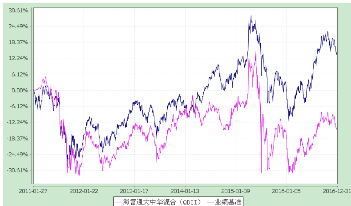
份额累计净值增长率与业绩比较基准收益率历史走势对比图 (2011 年 1 月 27 日至 2016 年 12 月 31 日)

注：1、按照本基金合同规定，本基金建仓期为基金合同生效之日起六个月，截至报告期末本基金的各项投资比例已达到基金合同第十四条（三）投资范围、（九）投资限制中规定的各项比例；