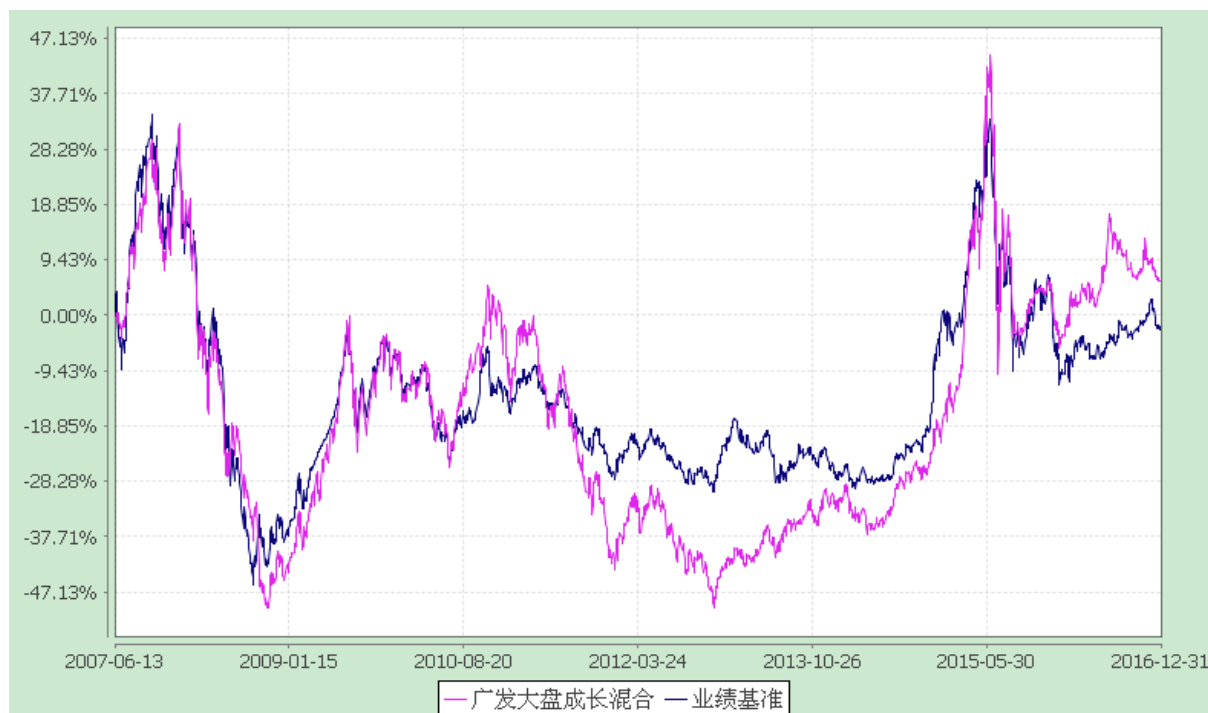
广发大盘成长混合型证券投资基金 份额累计净值增长率与业绩比较基准收益率的历史走势对比图 (2007 年 6 月 13 日至 2016 年 12 月 31 日)