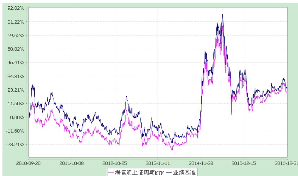
上证周期行业 50 交易型开放式指数证券投资基金 份额累计净值增长率与业绩比较基准收益率的历史走势对比图 (2010 年 9 月 19 日至 2016 年 12 月 31 日)

注：按照本基金合同规定，本基金建仓期为基金合同生效之日起三个月。截至报告期末本基金的各项投资比例已达到基金合同第十三章（二）投资范围、（六）投资限制中规定的各项比例。