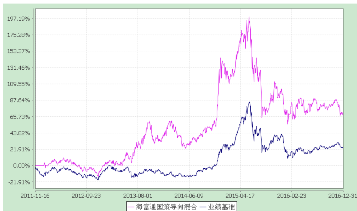
海富通国策导向混合型证券投资基金 份额累计净值增长率与业绩比较基准收益率的历史走势对比图 (2011 年 11 月 16 日至 2016 年 12 月 31 日)

注：按照本基金合同规定，本基金建仓期为基金合同生效之日起六个月。截至报告期末本基金的各项投资比例已达到基金合同第十四部分（二）投资范围、（七）投资限制中规定的各项比例。