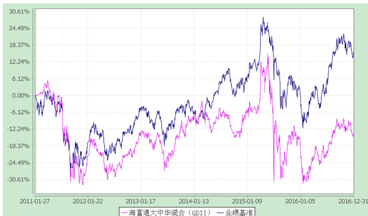
海富通大中华精选混合型证券投资基金 份额累计净值增长率与业绩比较基准收益率历史走势对比图 (2011年1月27日至2016年12月31日)