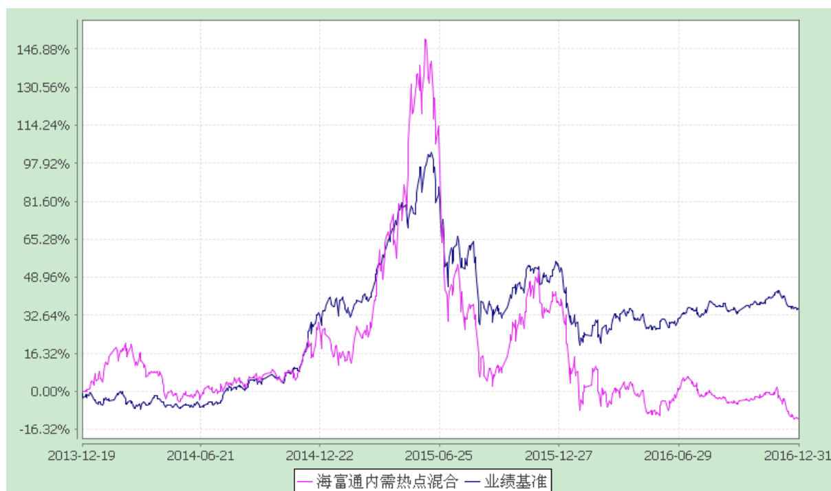
海富通内需热点混合型证券投资基金 份额累计净值增长率与业绩比较基准收益率的历史走势对比图 (2013 年 12 月 19 日至 2016 年 12 月 31 日)

注：按基金合同规定，本基金自基金合同生效起 6 个月内为建仓期，建仓期结束时本基金的各项投资比例已达到基金合同第十二部分（二）投资范围、（五）投资限制中规定的各项比例。