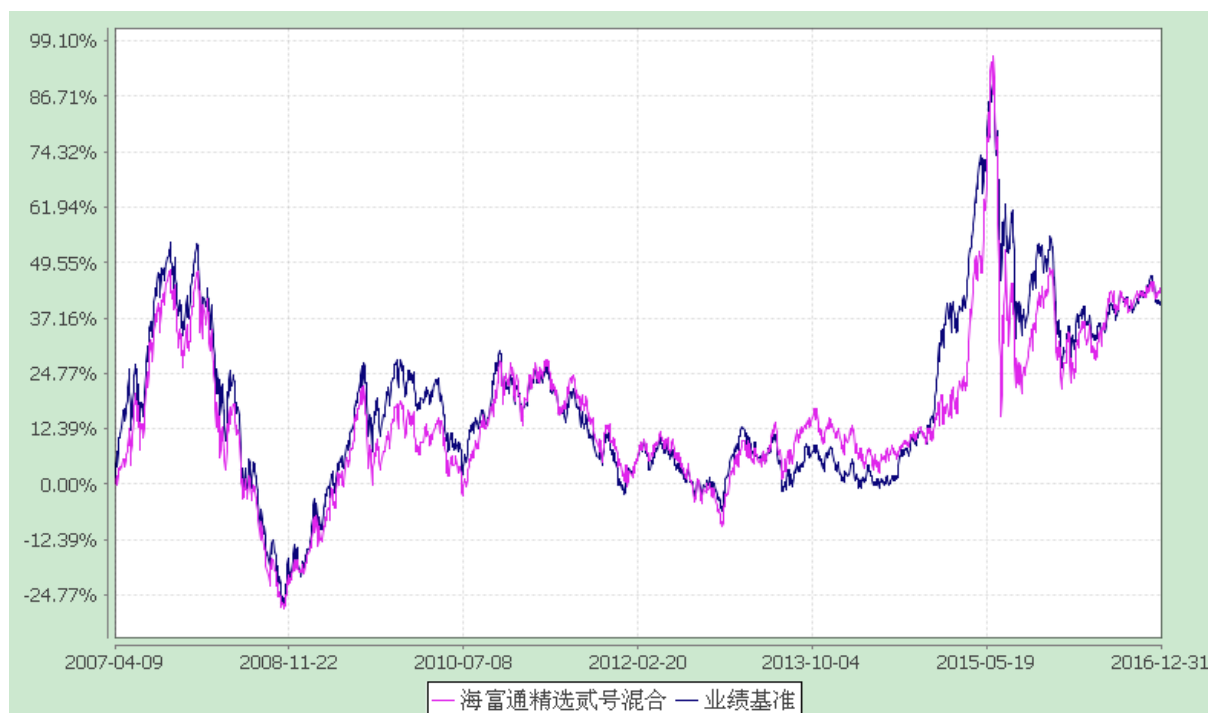
海富通精选贰号混合型证券投资基金 份额累计净值增长率与业绩比较基准收益率的历史走势对比图 (2007 年 4 月 9 日至 2016 年 12 月 31 日)

注：按基金合同规定,本基金自基金合同生效起 6 个月内为建仓期,建仓期满至今本基金的各项投资比例已达到基金合同有关投资范围的规定,即股票投资 50%-80%,债券投资 20%-50%,权证投资 0-3%;并保持不低于基金资产净值 5%的现金或者到期日在一年以内的政府债券。同时满足第 14 章(七)有关投资组合限制的各项比例要求。