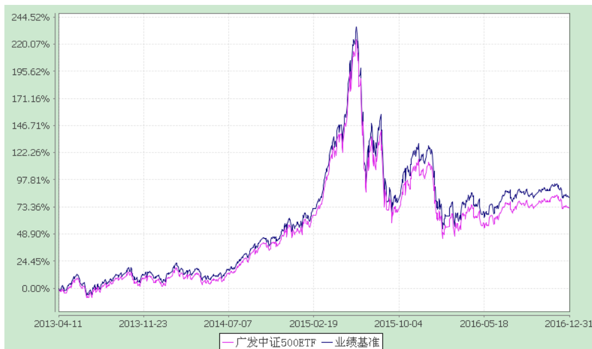
广发中证 500 交易型开放式指数证券投资基金 份额累计净值增长率与业绩比较基准收益率的历史走势对比图 (2013 年 4 月 11 日至 2016 年 12 月 31 日)