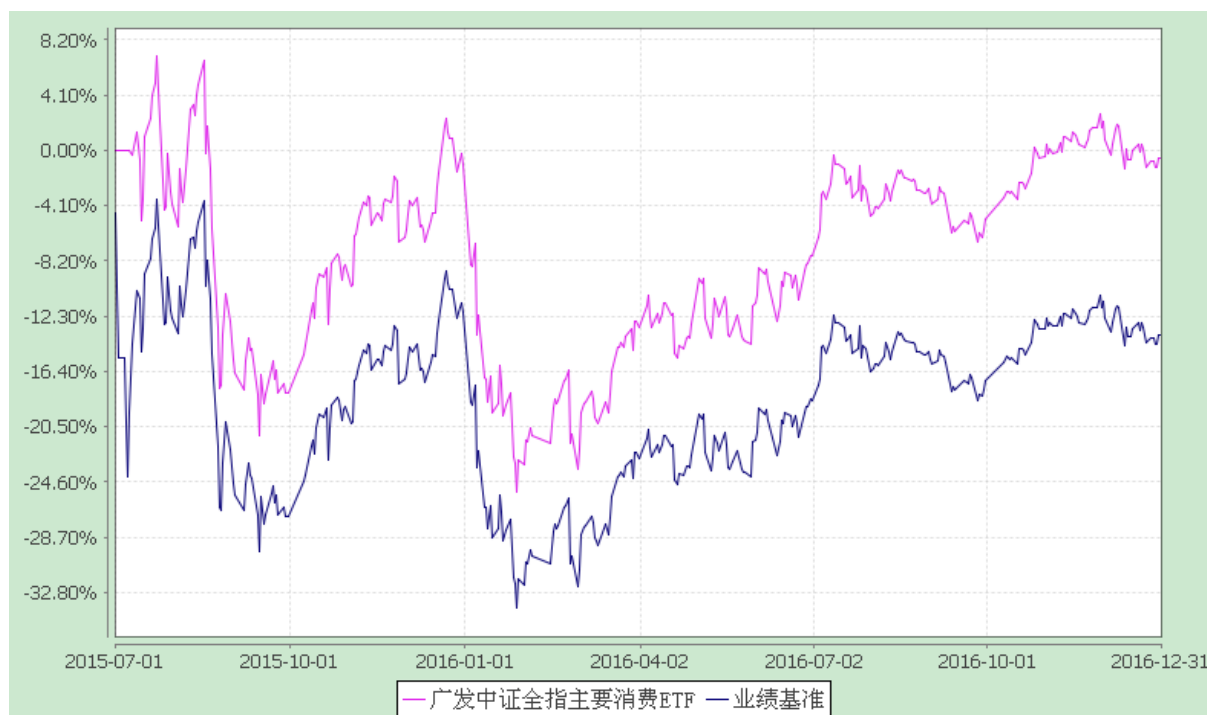
广发中证全指主要消费交易型开放式指数证券投资基金 份额累计净值增长率与业绩比较基准收益率的历史走势对比图 (2015年7月1日至2016年12月31日)