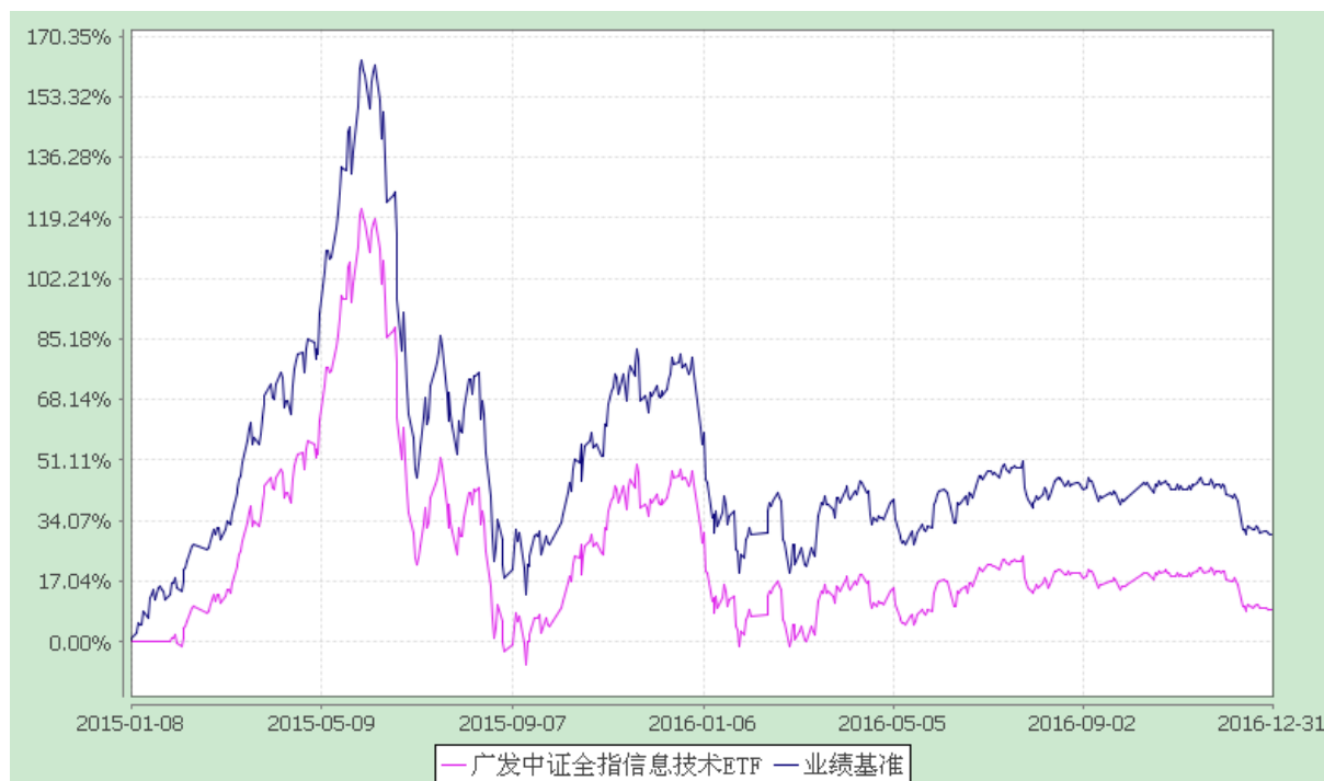
广发中证全指信息技术交易型开放式指数证券投资基金 份额累计净值增长率与业绩比较基准收益率的历史走势对比图 (2015 年 1 月 8 日至 2016 年 12 月 31 日)