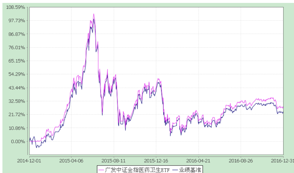
广发中证全指医药卫生交易型开放式指数证券投资基金 份额累计净值增长率与业绩比较基准收益率的历史走势对比图 (2014 年 12 月 1 日至 2016 年 12 月 31 日)