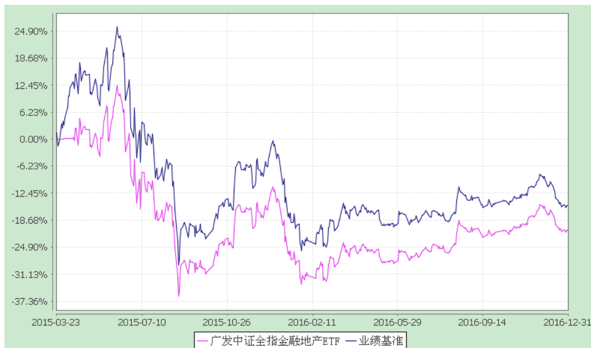
广发中证全指金融地产交易型开放式指数证券投资基金 份额累计净值增长率与业绩比较基准收益率的历史走势对比图 (2015年3月23日至2016年12月31日)