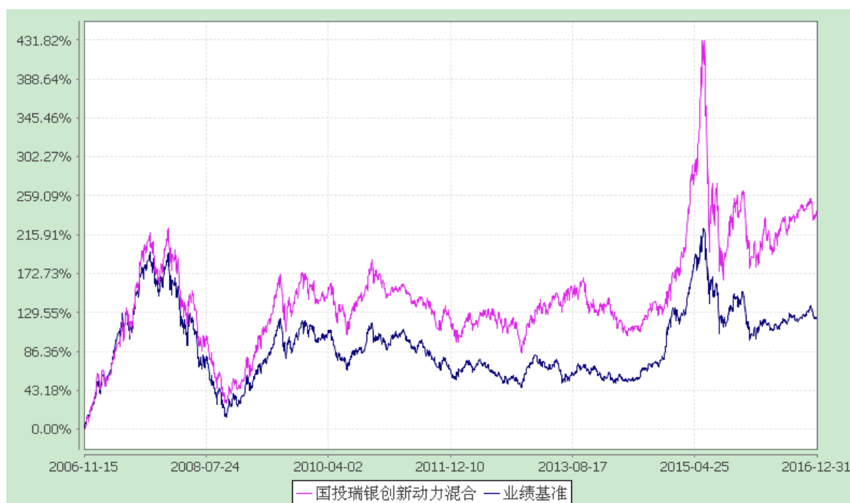
国投瑞银创新动力混合型证券投资基金 份额累计净值增长率与业绩比较基准收益率的历史走势对比图 (2006 年 11 月 15 日至 2016 年 12 月 31 日)

注：本基金建仓期为自基金合同生效日起的六个月。截至建仓期结束，本基金各项资产配置比例符合基金合同及招募说明书有关投资比例的约定。