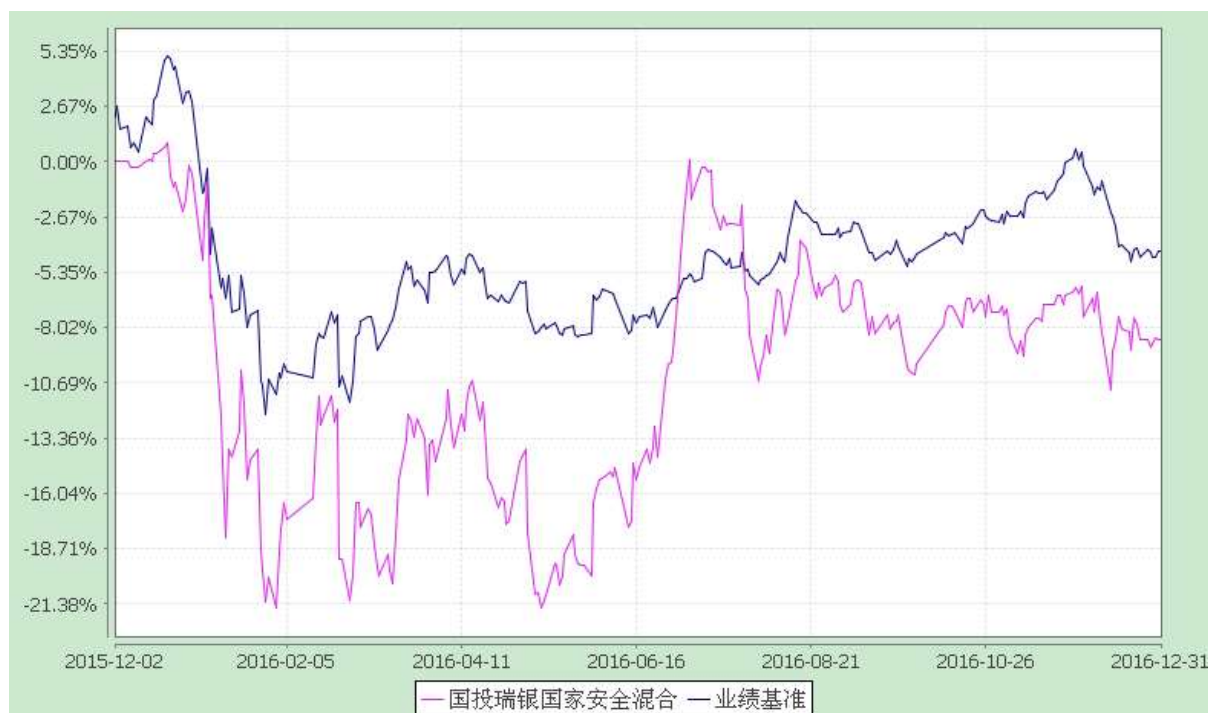
国投瑞银国家安全灵活配置混合型证券投资基金 份额累计净值增长率与业绩比较基准收益率的历史走势对比图 (2015 年 12 月 2 日至 2016 年 12 月 31 日)

注：本基金建仓期为自基金合同生效日起的 6 个月。截至建仓期结束，本基金各项资产配置比例符合基金合同及招募说明书有关投资比例的约定。