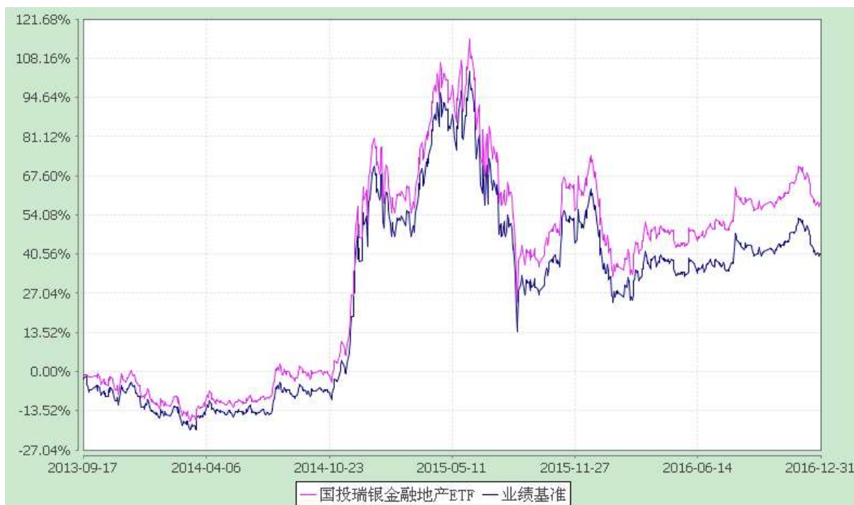
份额累计净值增长率与业绩比较基准收益率的历史走势对比图 (2013 年 9 月 17 日至 2016 年 12 月 31 日)

注：本基金建仓期为自基金合同生效日起的 3 个月。截至建仓期结束，本基金各项资产配置比例符合基金合同及招募说明书有关投资比例的约定。