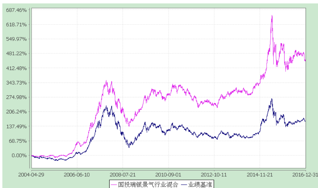
份额累计净值增长率与业绩比较基准收益率的历史走势对比图 (2004 年 4 月 29 日至 2016 年 12 月 31 日)

注：截至本报告期末各项资产配置比例分别为股票投资占基金净值比例 68.08%，权证投资占基金净值比例 0%，债券投资占基金净值比例 22.34%，现金和到期日不超过 1 年的政府债券占基金净值比例 23.79%，符合基金合同的相关规定。