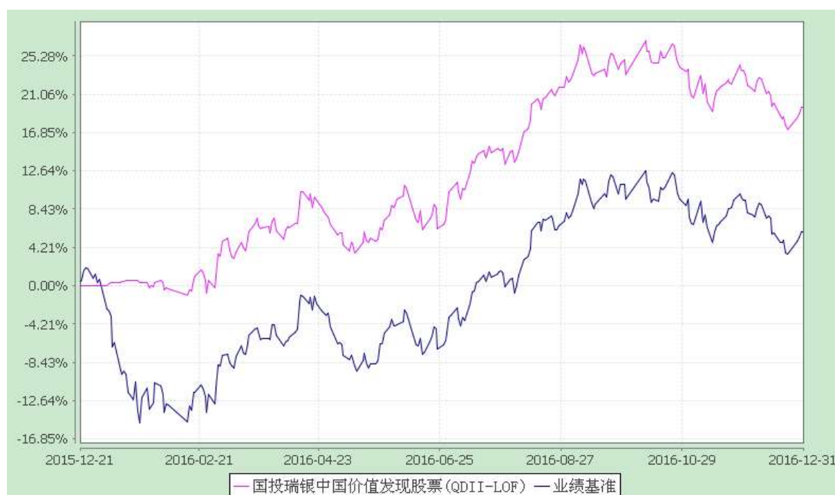
国投瑞银中国价值发现股票型证券投资基金（LOF） 份额累计净值增长率与业绩比较基准收益率历史走势对比图 （2015 年 12 月 21 日至 2016 年 12 月 31 日）