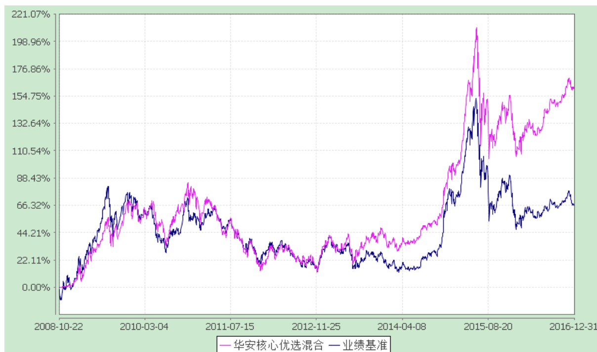
自基金合同生效以来份额累计净值增长率与业绩比较基准收益率的历史走势对比图 (2008 年 10 月 22 日至 2016 年 12 月 31 日)