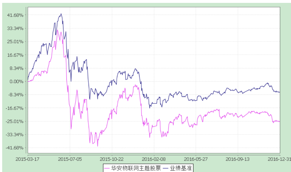
自基金合同生效以来份额累计净值增长率与业绩比较基准收益率的历史走势对比图 (2015 年 3 月 17 日至 2016 年 12 月 31 日)