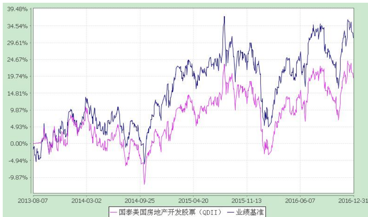
国泰美国房地产开发股票型证券投资基金 自基金合同生效以来份额累计净值增长率与业绩比较基准收益率历史走势对比图 (2013 年 8 月 7 日至 2016 年 12 月 31 日)

注：（1）本基金合同生效日为 2013 年 8 月 7 日，本基金在六个月建仓期结束时，各项资产配置比例符合合同约定；