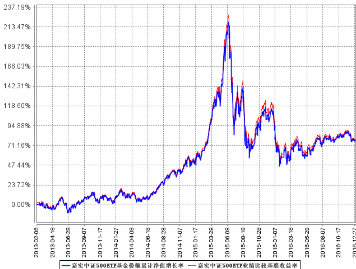
图：嘉实中证 500ETF 基金份额累计净值增长率与同期业绩比较基准收益率的历史走势对比图