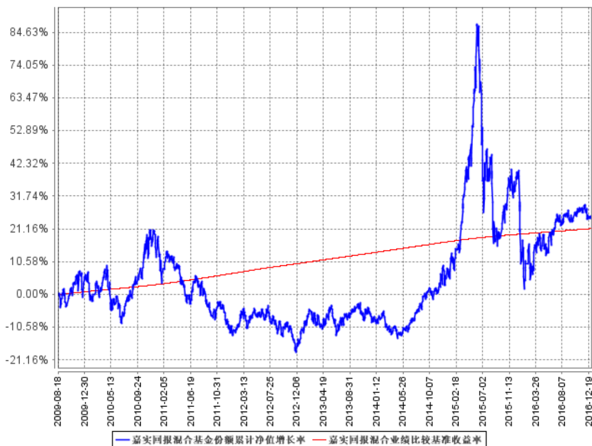
图：嘉实回报混合基金份额累计净值增长率与同期业绩比较基准收益率的历史走势对比图