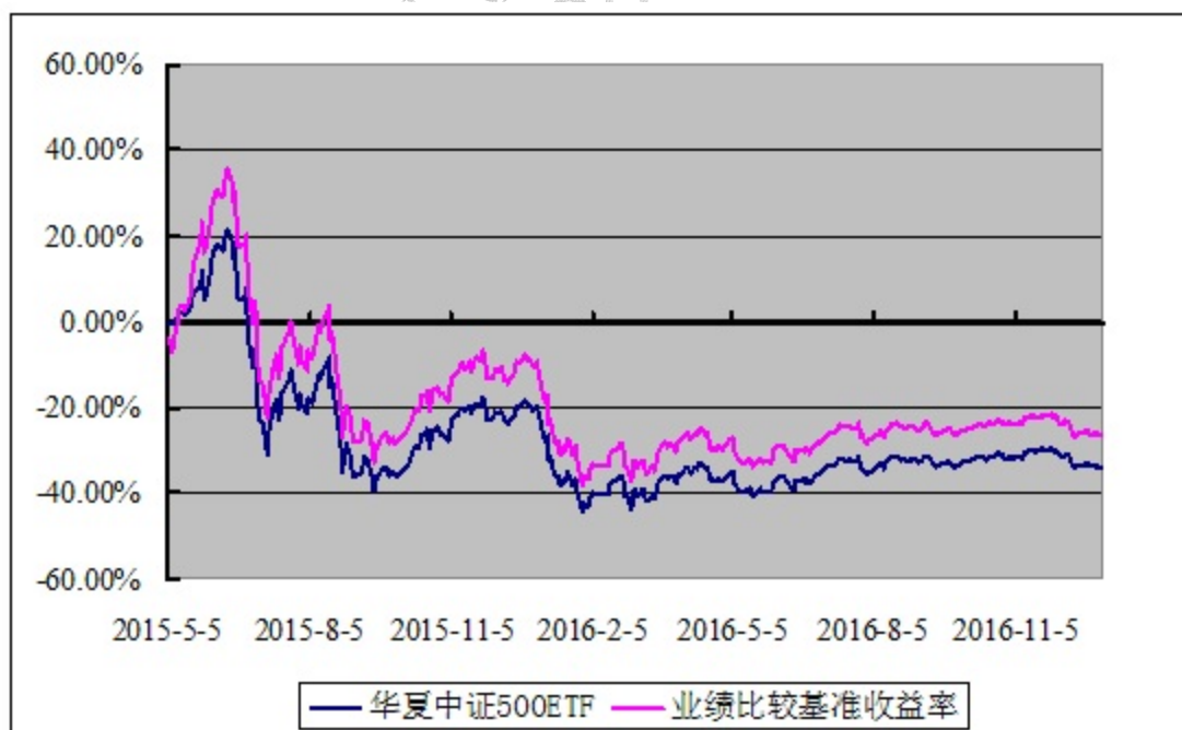
华夏中证 500 交易型开放式指数证券投资基金 份额累计净值增长率与业绩比较基准收益率历史走势对比图 (2015 年 5 月 5 日至 2016 年 12 月 31 日)