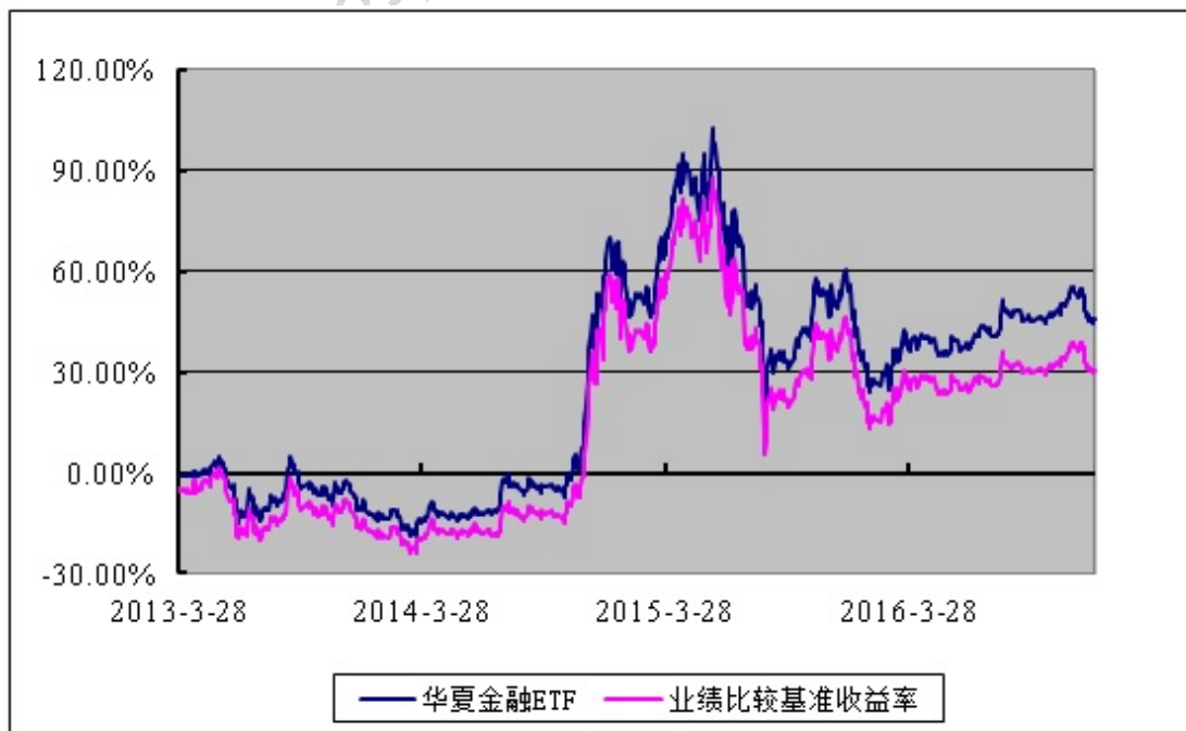
上证金融地产交易型开放式指数发起式证券投资基金 份额累计净值增长率与业绩比较基准收益率历史走势对比图 （2013年3月28日至2016年12月31日）