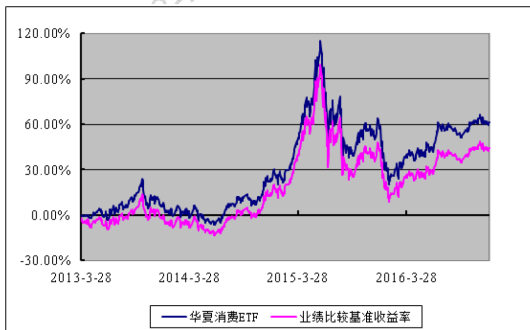
上证主要消费交易型开放式指数发起式证券投资基金 份额累计净值增长率与业绩比较基准收益率历史走势对比图 （2013年3月28日至2016年12月31日）