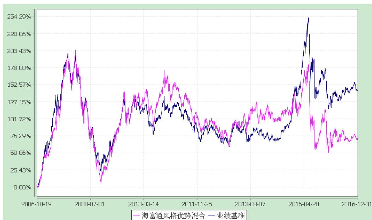
海富通风格优势混合型证券投资基金 份额累计净值增长率与业绩比较基准收益率的历史走势对比图 (2006 年 10 月 19 日至 2016 年 12 月 31 日)

注：1.根据基金合同规定,本基金自基金合同生效起 6 个月内为建仓期,即 2006 年 10 月 19 日至 2007 年 4 月 18 日。建仓期满至今,本基金的各项投资比例应达到基金合同第十二条(二)、(六)中规定的比例限制及本基金投资组合的比例范围。 2.为了能更公允地体现基金投资业绩,海富通基金管理有限公司自 2007 年 1 月 1 日起调整海富通风格优势基金业绩比较基准中股票部分的基准。原比较基准中的上证指数将调整为 MSCI China A 指数,相应的基准权重不变。