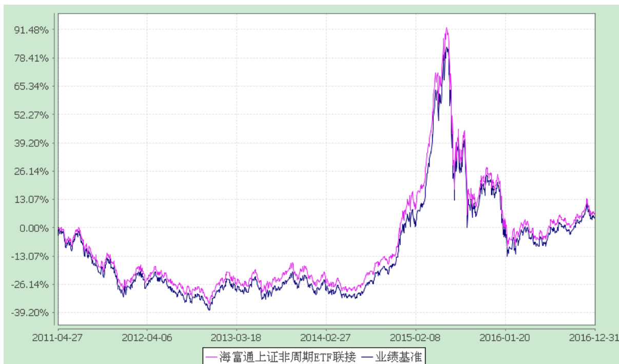
份额累计净值增长率与业绩比较基准收益率的历史走势对比图 (2011 年 4 月 27 日至 2016 年 12 月 31 日)

注：按照本基金合同规定，本基金建仓期为基金合同生效之日起三个月。截至报告期末本基金的各项投资比例已达到基金合同第十一部分（二）投资范围、（六）投资限制中规定的各项比例。