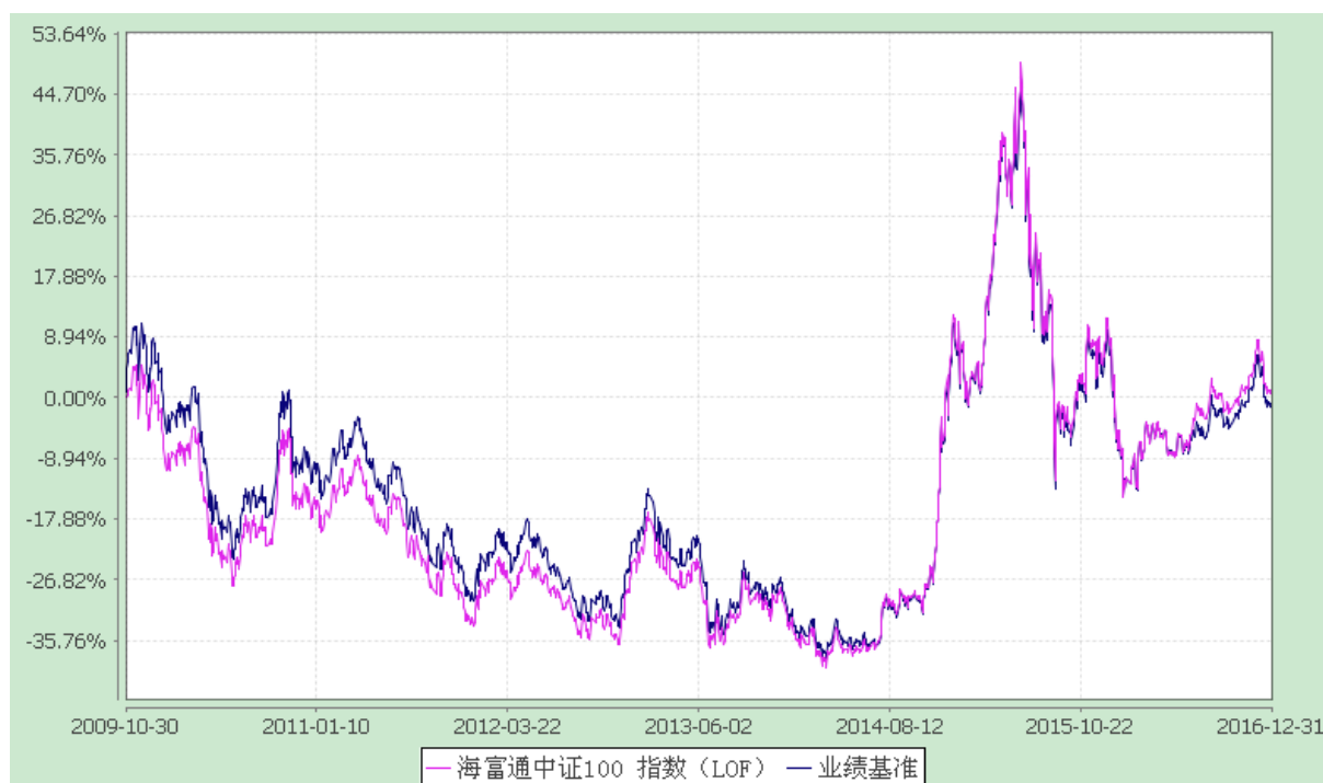
海富通中证 100 指数证券投资基金 (LOF) 份额累计净值增长率与业绩比较基准收益率的历史走势对比图 (2009 年 10 月 30 日至 2016 年 12 月 31 日)

注：按照本基金合同规定，本基金建仓期为基金合同生效之日起六个月。建仓期满至今，本基金投资组合均达到本基金合同第十五条（二）、（七）规定的比例限制及本基金投资组合的比例范围。