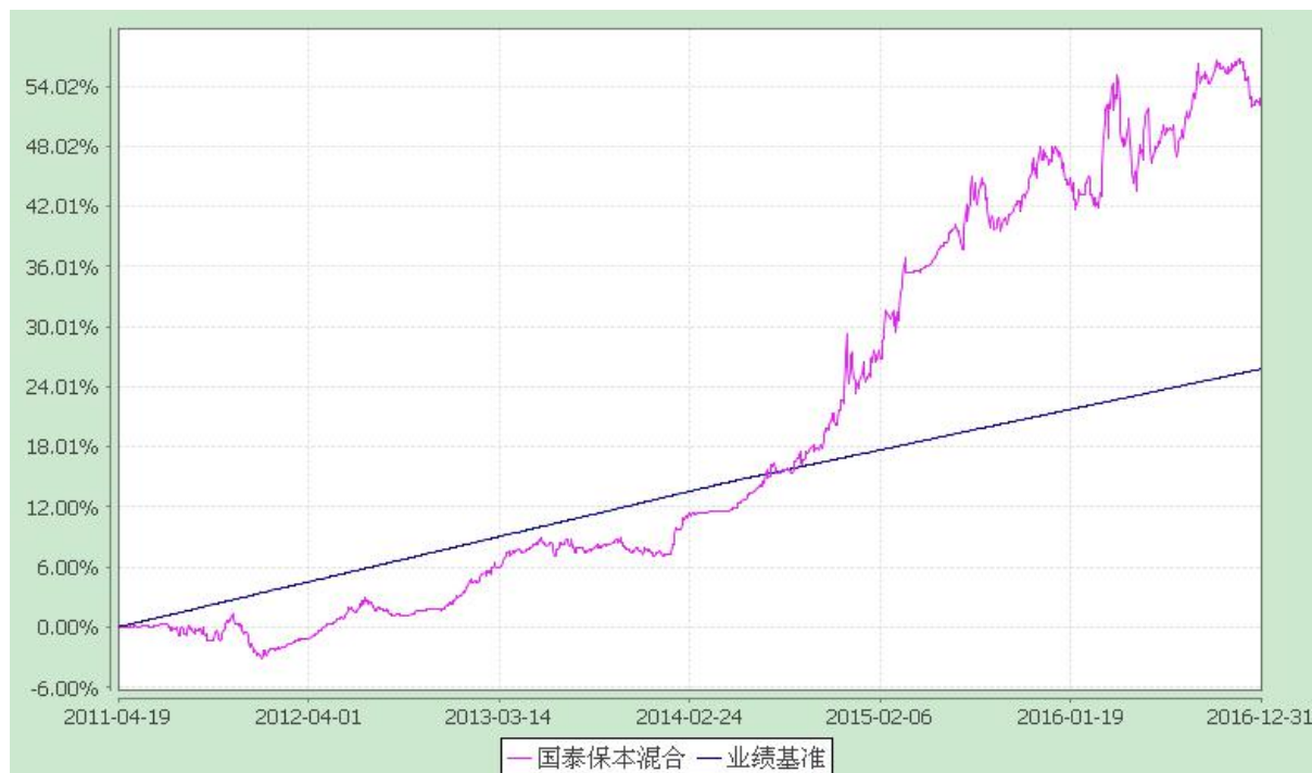
自基金合同生效以来份额累计净值增长率与业绩比较基准收益率的历史走势对比图 (2011 年 4 月 19 日至 2016 年 12 月 31 日)

注：本基金合同生效日为 2011 年 4 月 19 日。本基金在六个月建仓期结束时，各项资产配置比例符合合同约定。