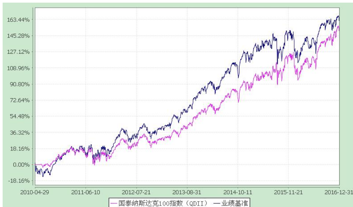
自基金合同生效以来基金份额累计净值增长率与业绩比较基准收益率历史走势对比图 (2010 年 4 月 29 日至 2016 年 12 月 31 日)

注：（1）本基金合同生效日为 2010 年 4 月 29 日。本基金在六个月建仓期结束时，各项资产配置比例符合合同约定；