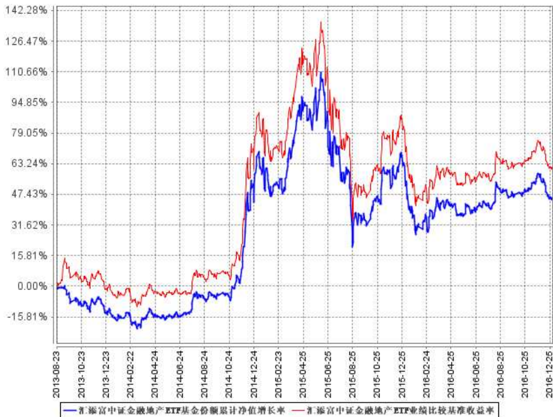
汇添富中证金融地产ETF基金份额累计净值增长率与同期业绩比较基准收益率的历史走势对比图

注：本基金建仓期为本《基金合同》生效之日（2013 年 8 月 23 日）起 3 个月，建仓结束时各项资产配置比例符合合同约定。